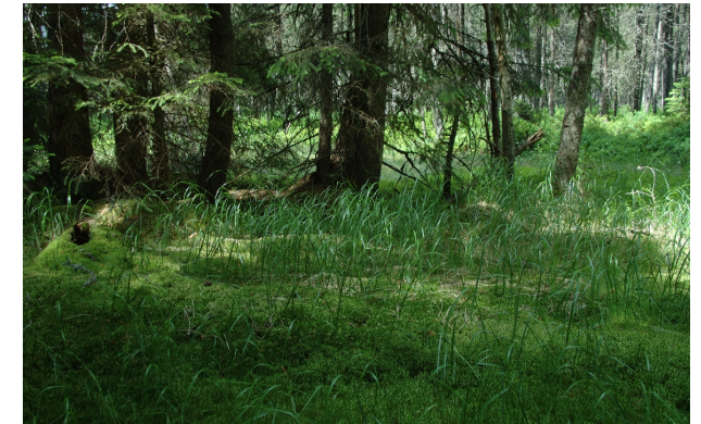
Sumpfiger Nadelwald im Hochschwarzwald, Lebensraum der Art

Das Herzblättrige Zweiblatt gedeiht vorwiegend in regenreichen und luftfeuchten Nadelforsten mit moosigen Untergründen. Ebenso werden nährstoffarme Moore mit Ausnahme der zentralen Moorbereiche besiedelt. Abgesehen von Küstenpopulationen liegen die Vorkommen in Gebieten mit über 1000 mm Jahresniederschlag. Da die Art in lockeren, sauren bis leicht sauren Humusschichten siedelt, kann der Unterboden auch aus basenreichen Gesteinen aufgebaut sein, solange die Individuen keinen direkten Kontakt zum basischen Unterboden haben. Die Standorte können mehr oder weniger licht sein. In Europa werden Standorte von Meereshöhe bis 2300 m besiedelt.