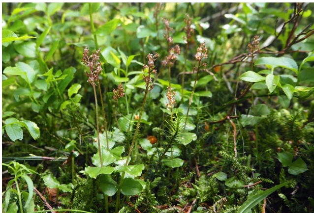
Typische Gruppen des Herzblättrigen Zweiblatts

Der Name beschreibt die beiden herzförmigen Blätter. Ein weiterer Name –Kleines Zweiblatt– weist auf ihre Kleinwüchsigkeit hin. Der lateinische Name Neottia (früher Listera ) cordata nimmt ebenfalls auf die Herzform der Blätter Bezug.