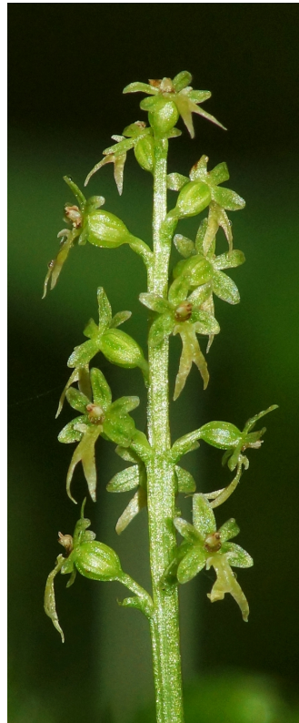
Blütenstand - grünliche Form

Blühende Exemplare erreichen eine Höhe von 7-15 cm. Charakteristisch sind die beiden herzförmigen, gegenständigen Blätter, die bis 2,6 cm lang und bis 2,2 cm breit werden und horizontal abstehen. Der zarte Stängel ist tief in Moospolster eingesenkt und hat am Grunde ein braunes Schuppenblatt. Einen Blütrieb bilden nur kräftige Pflanzen. Er ist locker mit 5-10 sehr kleinen Blüten besetzt. Sie tragen keinen Sporn und sind in frischem Zustand weit geöffnet, grün bis gelbgrün gefärbt oder häufig wie der obere Stängelabschnitt rotbraun überlaufen. Die Lippe ist tief gespalten und wird 4-6 mm lang. Die kurzen Seitenlappen der Lippe zweigen seitlich unterhalb der Narbe ab. Die Säule mit der Narbe steht mehr oder weniger waagrecht ab.